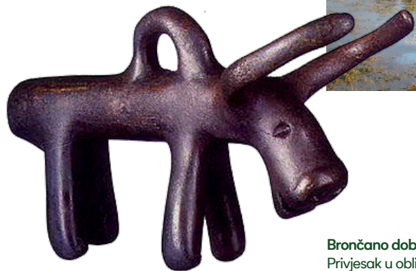
Brončano doba — prvi prikaz domaće životinje – Privjesak u obliku bika, ostava Poljanci I, 13.–12. stoljeće prije Krista